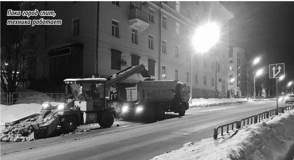
Пока город спит, техника работает

Нарушение данных требований является административным правонарушением, за которое статьей 3-7 областного закона от 01.02.2016 № 914-ОЗ «Об административных правонарушениях» предусмотрена административная ответственность. Впервые совершенное правонарушение влечет наложение административного штрафа на граждан в размере двух тысяч рублей; на должностных лиц и индивидуальных предпринимателей – десять тысяч рублей; на юридических лиц – пятьдесят тысяч рублей.