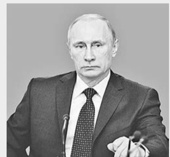
Владимир ПУТИН, Президент России:

Перед прививкой ребёнка осматривает врач, измеряет ему температуру. После вакцинации за его состоянием наблюдают в