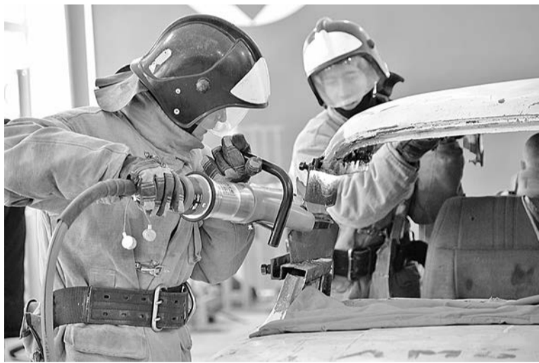
Соревнования по компетенции «Спасательные работы» прошли в новой мастерской технологического колледжа, которая была открыта в прошлом году в рамках регионального проекта «Молодые профессионалы» нацпроекта «Образование»

Четвёртое место – у Боровичского педагогического колледжа. Его студенты стали обладателями 11 золотых, 6 серебряных и 7 бронзовых наград. Пятую строчку в медальном зачёте занял Боровичский автомобильно-дорожный колледж. В его копилке – 11 золотых медалей, 7 серебряных и 3 бронзовых.