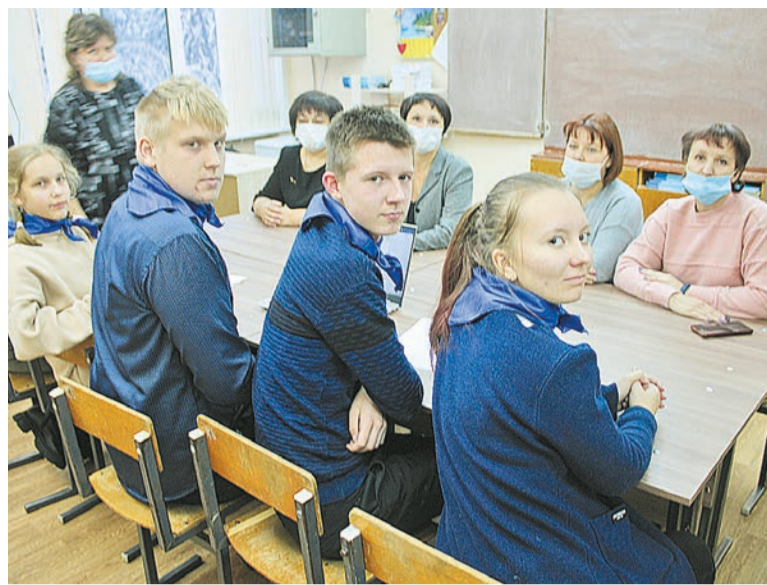
Инициативной группе – наши поздравления!