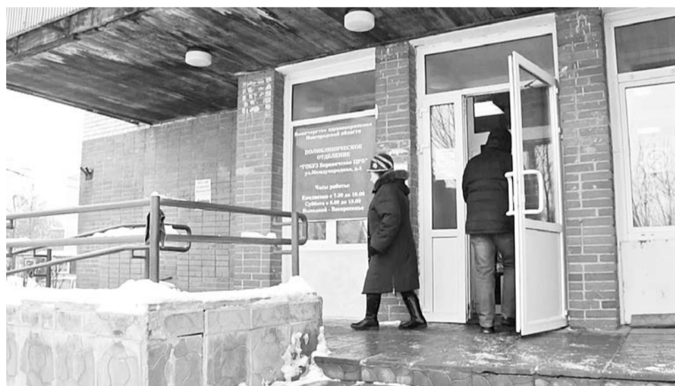
Для качественной работы в дистанционном формате в поликлинике организован кол-центр