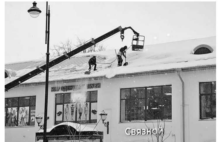
Показательный пример для других!

Глава Сушанского сельского поселения и председатель Думы муниципального района Сергей Кузяков отметил, что претензии к подрядчикам случаются, но главы поселений на месте разбираются в ситуации и контролируют ход работ.